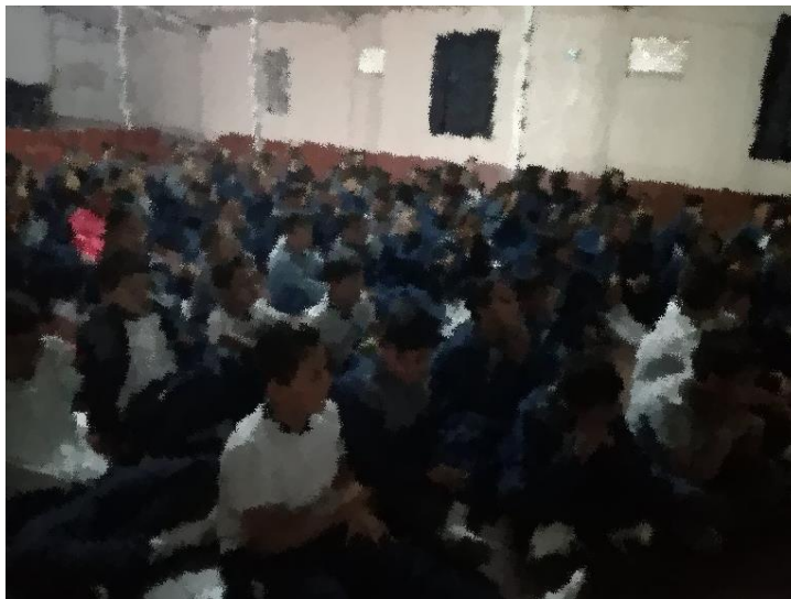
Fotografía 4: Foto tomada por Sánchez Mayra “Encuentro de estudiantes y socialización de la experiencia”.

realizar este ejercicio era poder realizar al finalizar cada periodo un recorrido con los padres para observar los avances y recoger la cosecha.