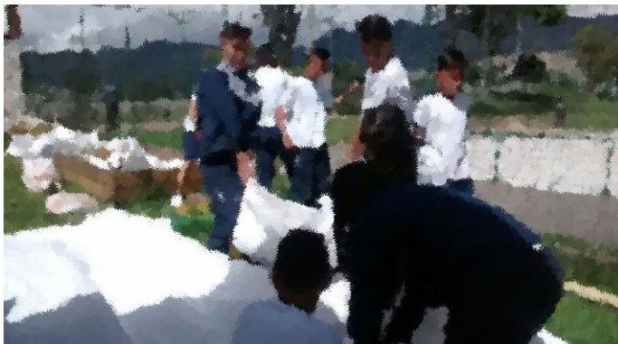
Fotografía 8: Proceso de siembra.

Día de por medio los estudiantes se encargaban de realizar la visita al huerto para realizar el riego y observar que sus camas estuvieran en buen estado, también realice capacitación a los docentes para que este lugar fuera mágico en la construcción de conocimiento buscando una interdisciplinariedad en las áreas, propósito que se cumplió ya que las docentes de primaria me contaban con antelación que realizan actividades con los niños. Ejemplo: la docente de lenguaje se dirigía a trabajar el cuento con los estudiantes de primero y luego de la explicación debían escribir teniendo en cuenta los elementos que tenían a su alrededor.