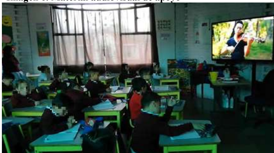
Imagen 6. Material audiovisual de apoyo

Se asignaban las preguntas para desarrollar en el transcurso de la semana y se realizaban las retroalimentaciones en la próxima clase a los ocho días, los niños realizaban la socialización oral de sus investigaciones y se apoyaba esta actividad con videos musicales, videos donde se interpretaban los instrumentos que eran objeto de la investigación de esa semana, videos donde se puede apreciar la elaboración de los instrumentos, también se planteó la elaboración de instrumentos como castañuelas que los niños trajeron al aula de clase para jugar y compartir con sus compañeros.