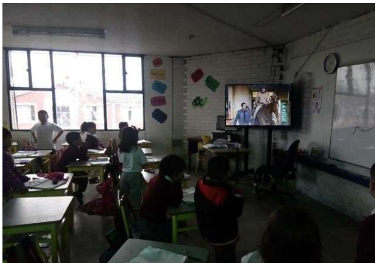
Imagen 2. Sensibilización película una noche en el museo

Durante este primer año mantuve el manejo del “cuaderno de investigación” dentro del cuaderno de español sin separarlo, formulando algunos temas de manera intermitente, realizando micro investigaciones, así como actividades de sensibilización como lo fueron ver y realizar un pequeño análisis con los estudiantes de la película, Una noche en el museo, así como la lectura y observación de imágenes del libro Lucas un detective en el museo, esto con el fin de poder observar que nivel de interés despertaba en los niños este tipo de actividades y temas con los que muchas veces no están familiarizados en su contexto.