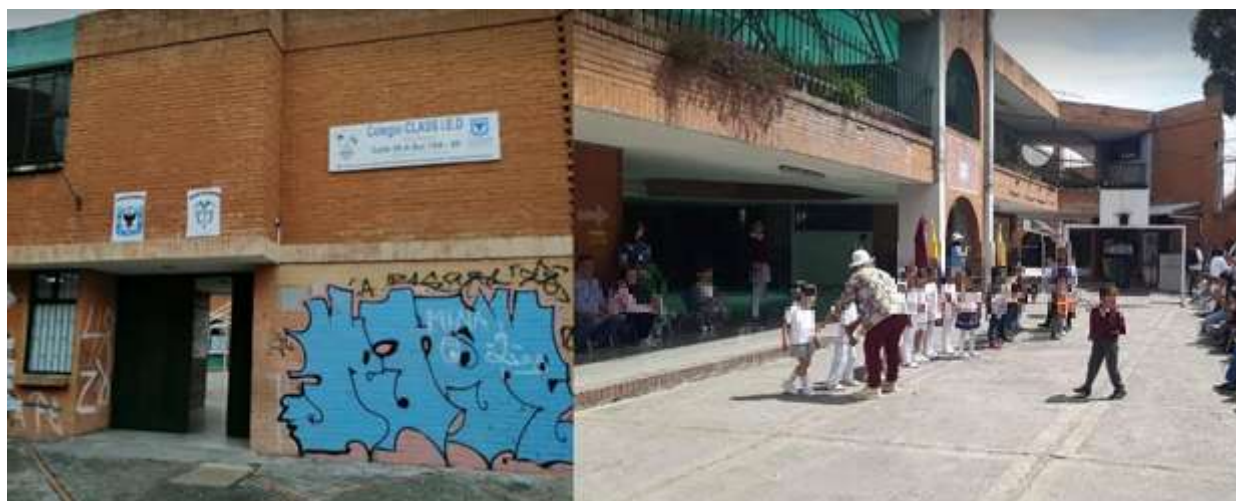
Imagen 1. IED Class, sede B