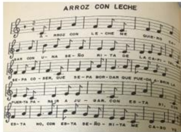
La vida familiar