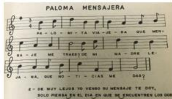
La vida de los animales