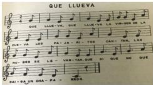
La bella naturaleza