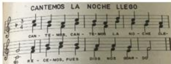
Canciones de cuna