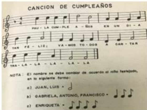
La vida escolar